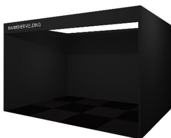
Foto: Impressie Uniforme Standbouw

Hierbij twee voorbeelden van de uniforme standbouw: