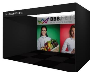
Foto: Impressie Uniforme standbouw incl. Full Colour achterwand

Let op: er is standaard een contactdoos van 3,5kW voor eigen gebruik aanwezig in je stand en de elektra is alleen overdag inbegrepen. Eventuele nachtstroom of extra aanvragen kun je via de webshop bestellen.